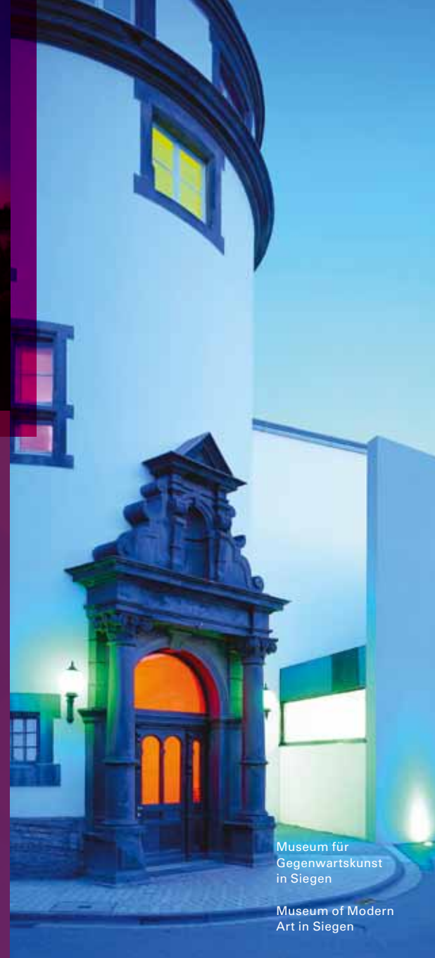
Museum für Gegenwartskunst in Siegen

Siegen-Wittgenstein creates permanent impressions! For example at the “Giller” near Hilchenbach: Europe’s biggest “tent-festival” called “KulturPur” takes place here regularly at Whitsun. In Siegen the Apollo-Theatre impresses with its theatre and music. A few minutes away the Culture House Lütz is home to cabaret, music hall and floor shows. Siegen-Wittgenstein also has its own Philharmonic orchestra, the Philharmonic South-Westphalia, which not only exalted in the Papal Basilica in Rome but also in local community centres. The Siegerland Museum in the Upper Castle presents paintings by Peter Paul Rubens, Siegen’s most famous son.