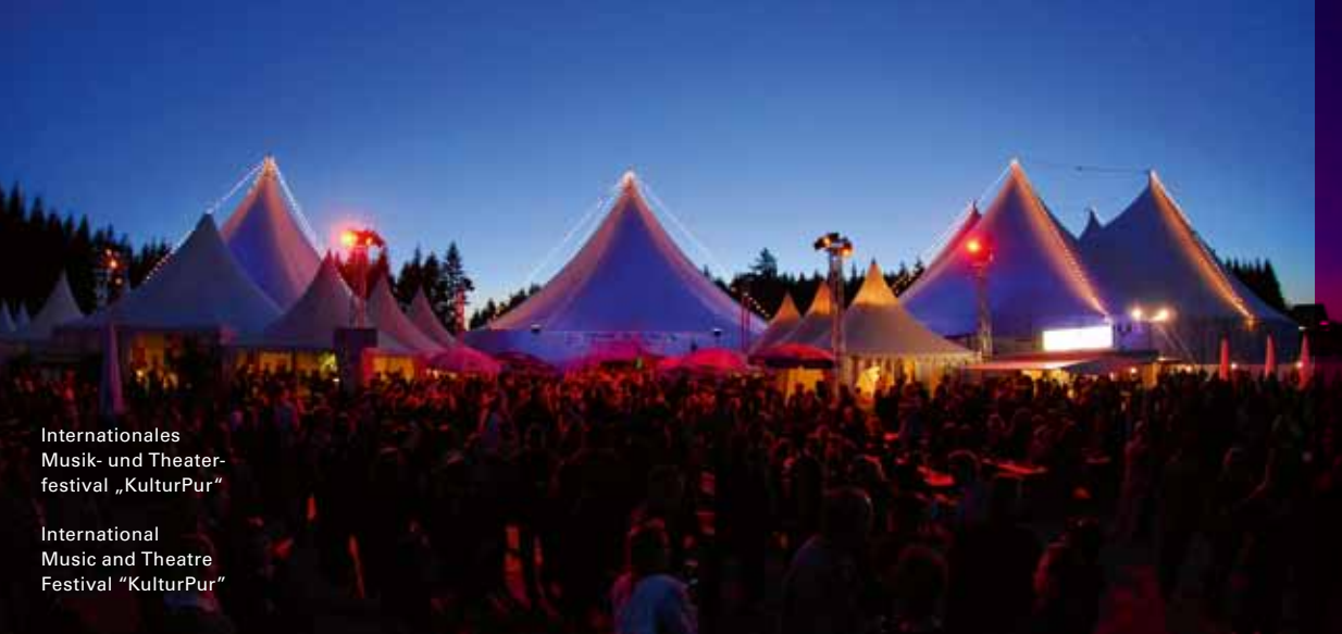
Internationales Musik- und Theater- festival „KulturPur“