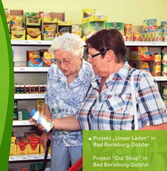
▲ Projekt „Unser Laden“ in Bad Berleburg-Dotzlar

Students, who live with senior residents under one roof, who help them with their daily routines and in return have cheap accommodation? A shop within reach of elderly inhabitants which at the same time integrates disabled people in the village life? In Siegen-Wittgenstein examples of real life, thanks to the county-wide project “living and residing in later life” which supports and coordinates such projects. Senior citizen policy is a task addressed in a unique success story together by local actors. Elderly people are not left out; they are the middle of the community. They use a wide-range of out-patient facilities, ranging from daily help to housing guidance, care-support, mobility and culture, fitness and education. Senior citizen advice centres in all towns or communities are willing to help further.